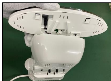
LEDパーツを取り外す ※LEDパーツにケーブルが 接続されているので断線 しないようにゆっくりと 外してください