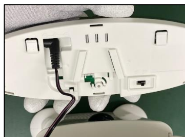
ケーブルを爪2ヶ所に 引っ掛ける