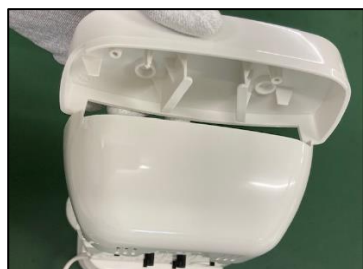
顔パーツを取り外す