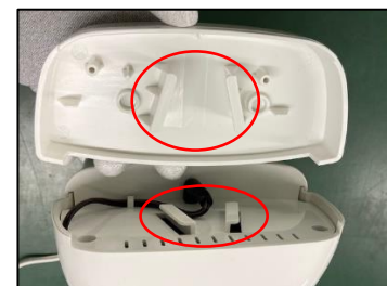
本体の八の字の出っ張りに 顔パーツの八の字の出っ張り を引っ掛ける形で顔パーツを 取り付ける