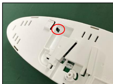
本体から出ているケーブルをLEDパーツに接続する