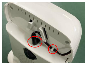
本体の爪にケーブルを引っ掛け 中央の穴にケーブルを差し込む