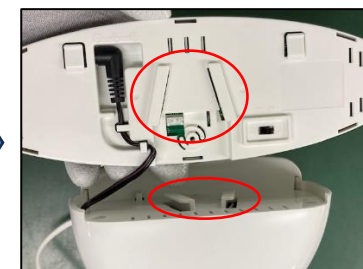
本体の八の字の出っ張りに LEDパーツの八の字の出っ張り を引っ掛ける形でLEDパーツを 取り付ける